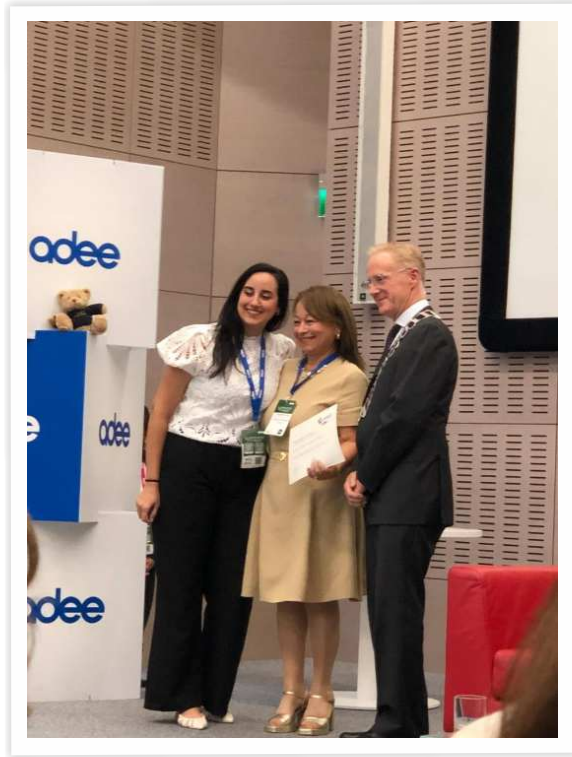
Août 2025 : Réception du certificat