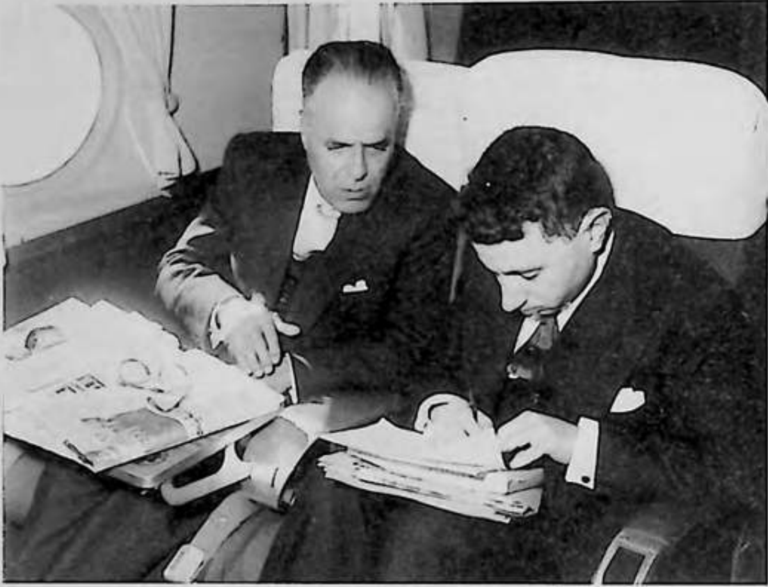
مصطفى الفيلاي مع الرئيس بورقيبة في جلسة عمل أثناء رحلة جوية