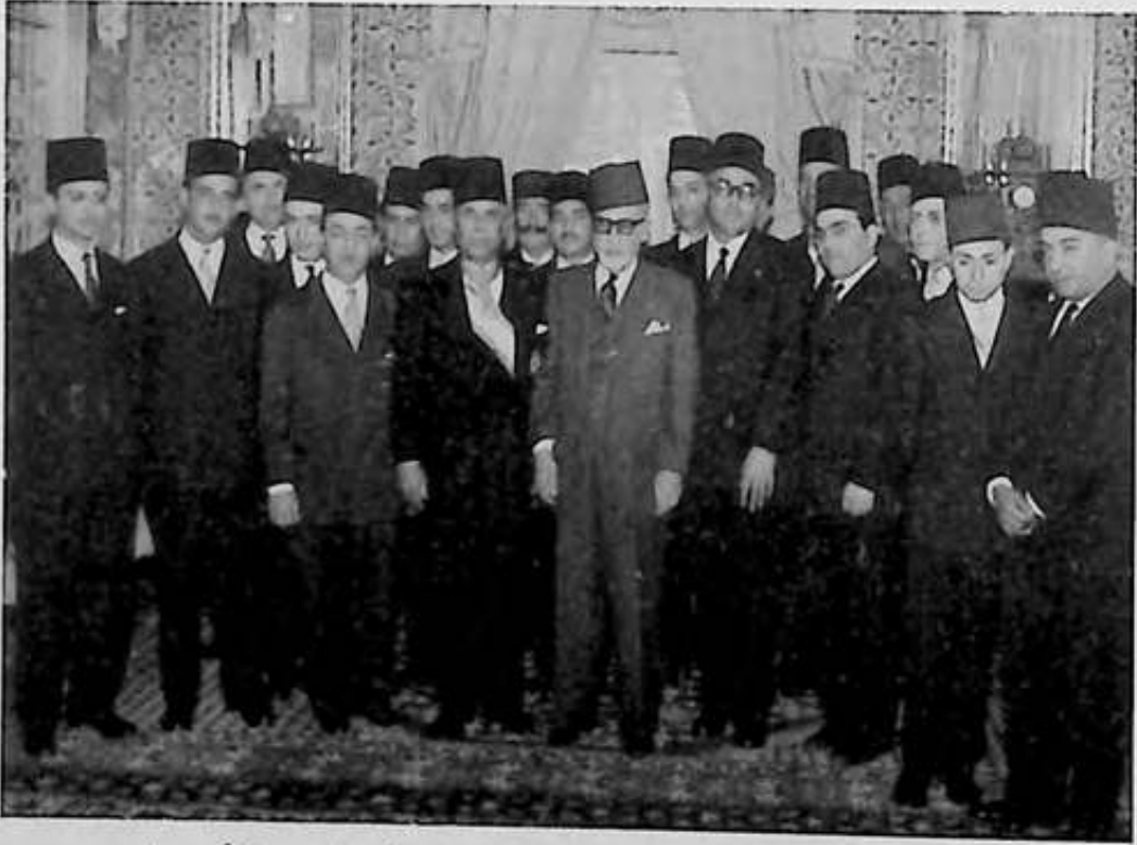
مصطفى الفيلاي، الثاني على اليمين، في صورة تذكارية مع الأمين باي بعد تشكيل أول حكومة إثر الاستقلال (15 أبريل 1956)